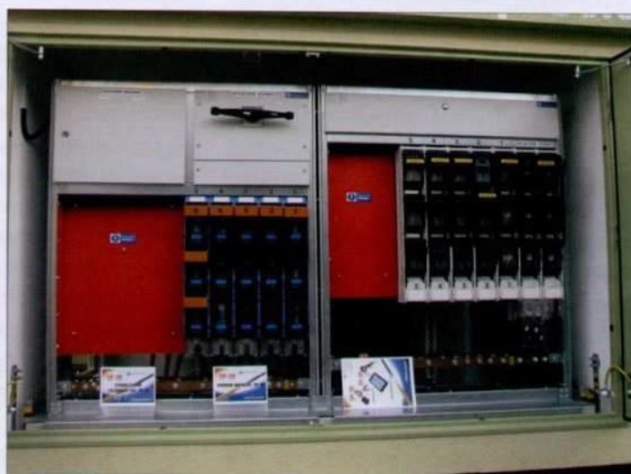
Fot. 1. Widok rozdzielnicy nn prefabrykowanej stacji transformatorowej

Stacja może posiadać jedno-, dwu- lub czterospadaowy dach, wykonany jako nakładka na właściwy stropodach lub jako integralna część obiektu. Kolory elewacji zewnętrznych budynku oraz elementów jego ślusarki mogą być praktycznie wykonane we-